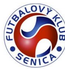
FK SENICA (SVK)