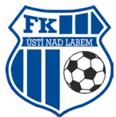
FK ÚSTÍ NAD LABEM