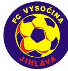
FC VYSOČINA JIHLAVA