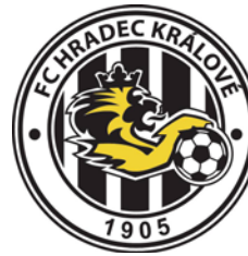
FC HRADEC KRÁLOVÉ