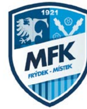
MFK FRÝDEK - MÍSTEK