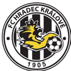
FC HRADEC KRÁLOVÉ