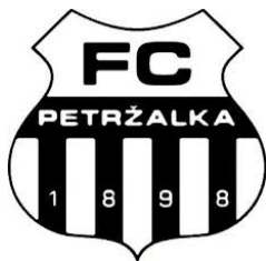
FC PETRŽALKA (SVK)