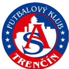
AS TRENČÍN (SVK)