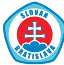
ŠK SLOVAN BRATISLAVA (SVK)