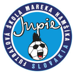
JUPIE BANSKÁ BYSTRICA (SVK)