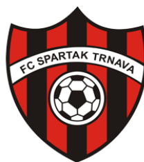
FC SPARTAK TRNAVA (SVK)