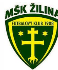
MŠK ŽILINA (SVK)